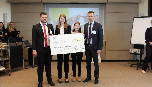
Johannes Kepler University Linz